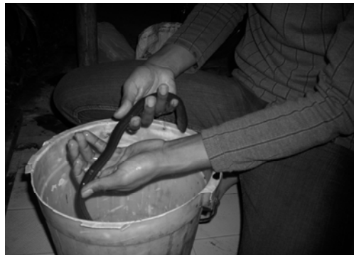
Gambar 4. Pemanenan