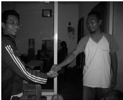
Gambar 6. Penjualan Produk