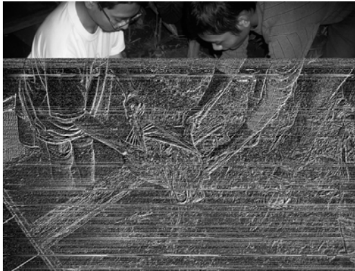
Gambar 3. Penebaran Benih.