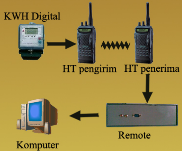
Foto alat dan praktek PKM